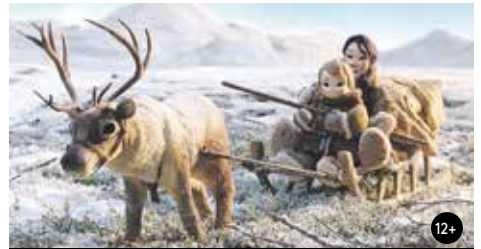
MATKA ZEMĚ 15:30/GAC 2