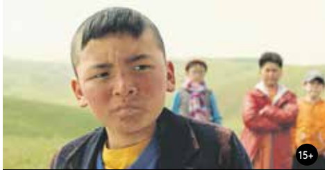
HORSKÁ CIBULE 19:30/GAC 5