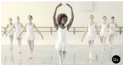
NENEH SUPERSTAR 16:00/GAC 3