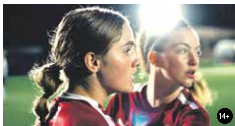
FOREVER 16:00/GAC 3