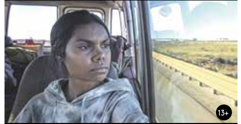
KRAJINA UVNITŘ 15:00/GAC 6