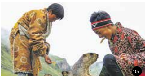
PRVNÍ VELKÁ ZKOUŠKA 13:30/GAC 3