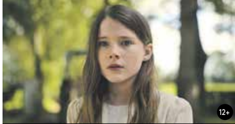
TICHÁ DÍVKÁ 17:30/GAC 6