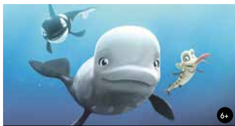
KATAKOVO VELKÉ DOBRODRUŽSTVÍ 16:00/GAC 3