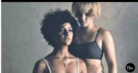
DŮM ZTRACENÝCH DUŠÍ 19:30/GAC 5