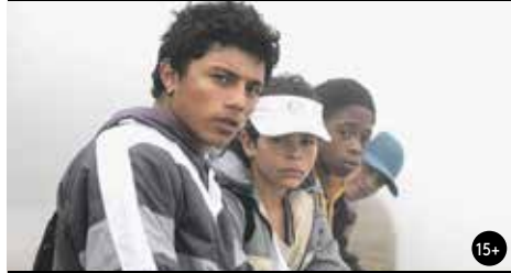
KRÁLOVÉ SVĚTA 20:00/GAC 6