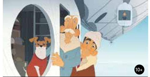
TITINA, PSÍ POLÁRNICE 14:30/GAC 5