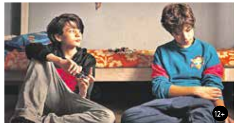
NOSOROŽEC 15:00/GAC 6