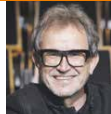
Jerzy Moszkowicz (Polsko)