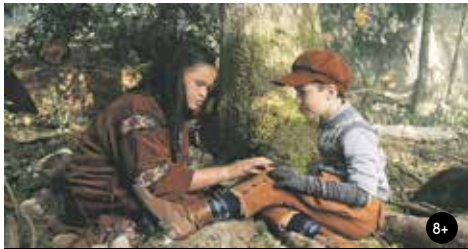
DOBRODRUŽSTVÍ V ZEMI INDIÁNŮ 15:00/GAC 6