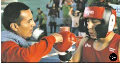
BANTAMOVÁ VÁHA 17:30/GAC 6