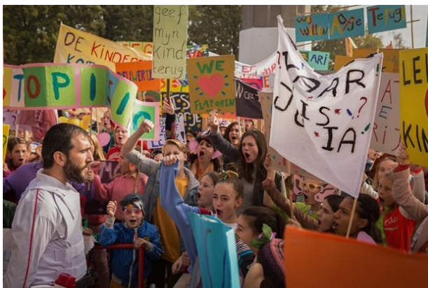
Barvy: různobarevnost, mnoho barev