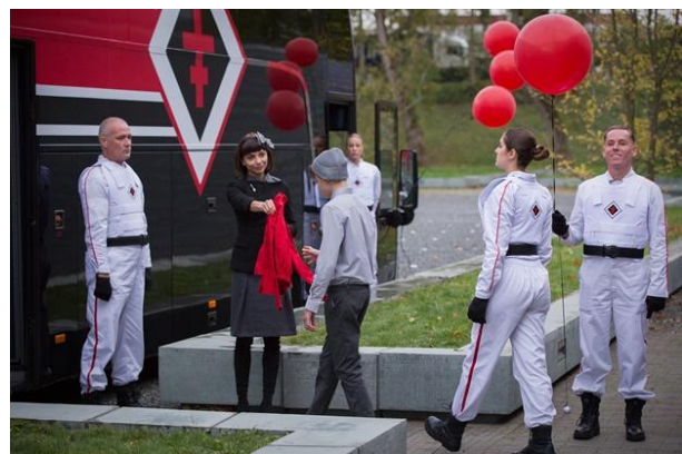
Barvy: odstíny šedé